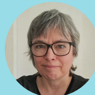
Region Gävleborg Line Rudvall, Arkivarie